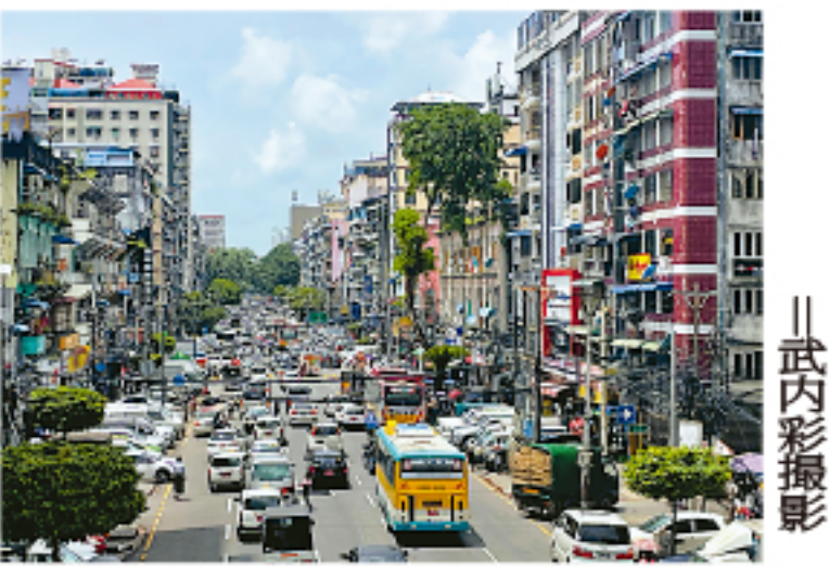
ミャンマー軍政の弾圧に抗し、ウェブマガジンで発信する「反骨の記者」。彼らが語る言論の自由とは。