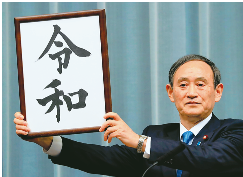
新元号「令和」を発表する菅義偉官房長官 —総理大臣官邸で1日午前11時41分