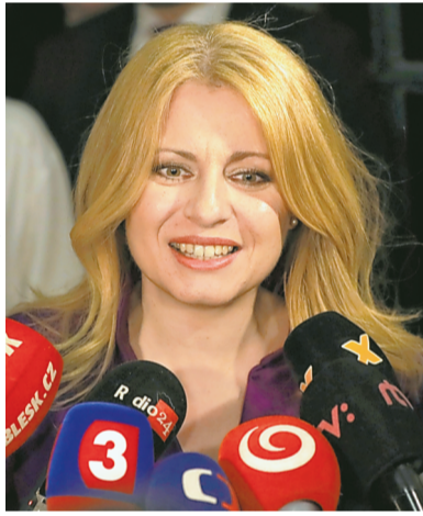
スロバキアの大統領に当選したチャプトバさん

スロバキアでは昨年2月、政権の不正の疑いを調べていたジャーナリストが殺され、政権への批判が高まっていました。チャプトバさんは、政治を改めることや、性的少数者の権利を守ることを訴えました。ただ、大統領の役割は限定的で、政治の実権は首相にあります。