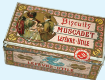
<ルフェーヴル・ユティル社の ビスケット缶容器> 1901年