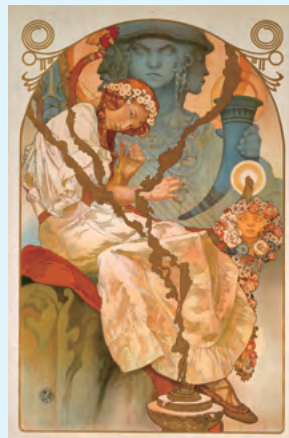
<スラヴ叙事詩展> 1928年