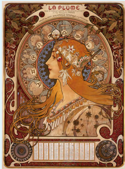
<黄道十二宮 ラ・ブリュム誌のカレンダー> 1896年

本展ではミュシャ作品の世界的収集家として知られる尾形寿行氏のコレクションからポスター、装飾パネルをはじめ、デザイン集、ポストカード、切手、紙幣、商品パッケージなど約500点を展示、その生涯に迫ります。